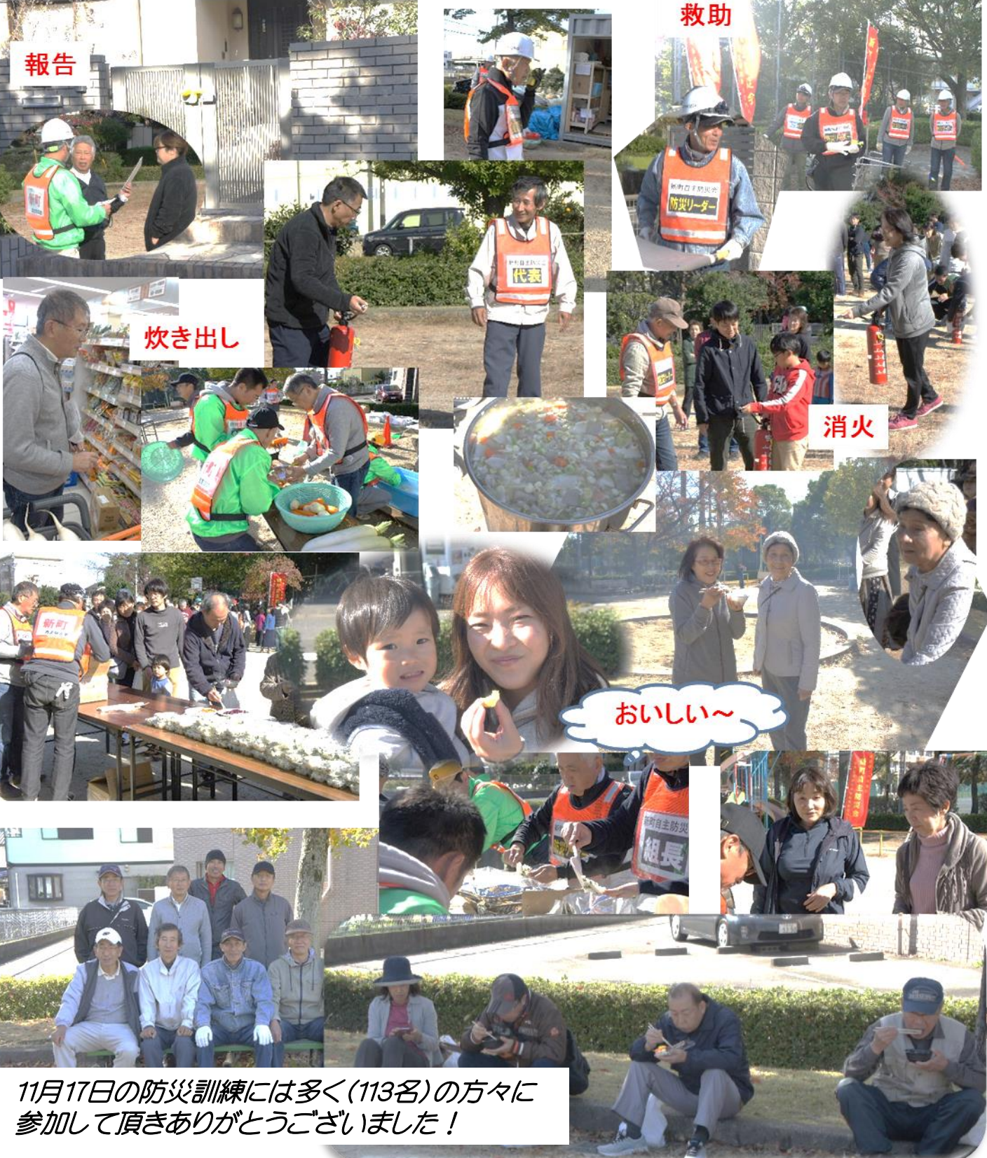
11月17日の防災訓練には多く(113名)の方々に 参加して頂きありがとうございました！