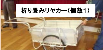
折り畳みリヤカー(個数1)