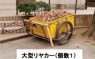
大型リヤカー(個数1)